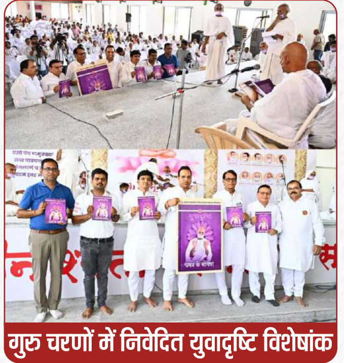
गुरु चरणों में निवेदित युवादृष्टि विशेषांक

तपोयज्ञ के अंतर्गत इस सत्र से प्रारंभ किये गये एक नये उपक्रम 'त्यागी थर्सडे' में मई 2024 तक 1170 साथियों ने जमीकंद का त्याग कर अपनी सहभागिता दर्ज की है।