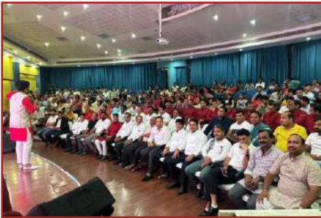
भिक्षु भजन संध्या-राजाजीनगर