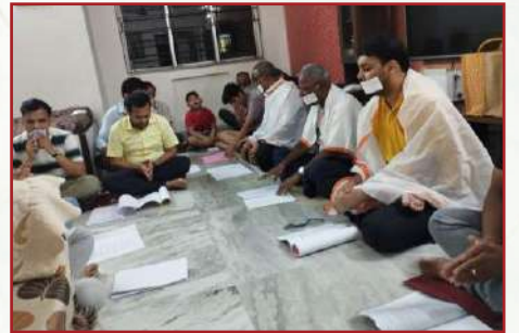
धम्म जागरण-उत्तर कोलकाता