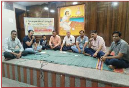
धम्म जागरण-टी. दासरहल्ली