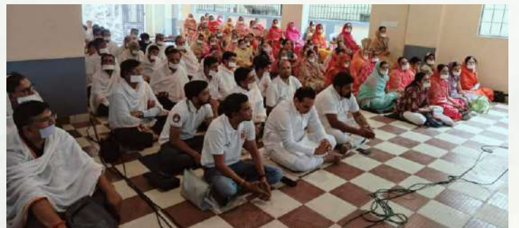
वीतराग पथ कार्यशाला-विजयनगर, दि. 09 मई 2024