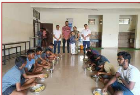
सेवा कार्य-टी. दासरहल्ली